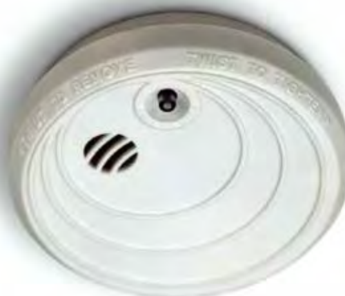
Det ska finnas minst en uppsatt och fungerande brandvarnare i varje lägenhet. Billigare liv- och egendomsförsäkring är svårt att hitta.

brandvarnare installeras, men att de boende sedan själva ansvarar för att regelbundet prova att den fungerar och byta batterier vid behov.