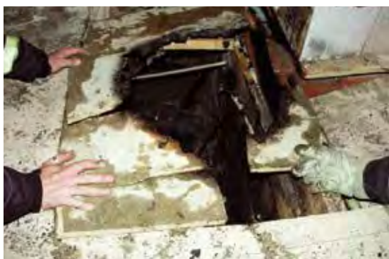
Felaktigt hanterad aska är en vanlig brandorsak. Här har golvet brunnit när aska från en kakelugn som det eldats i dagen före ställts i en plastpåse på golvet.

Bränder i bostäder är ofta eldstadsrelaterade. Därför är det viktigt att uppmärksamma säkerheten kring eldstäder. De boende behöver informeras om vad som gäller för de lokala eldstäder som finns i fastigheten, exempelvis kakelugnar och öppna spisar. Viktig information är om det får eldas i dessa, vad som i så fall får eldas, i vilken omfattning det får eldas och hur askan ska hanteras.