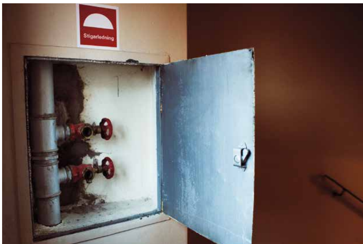
Via stigarledningen i trapphuset får räddningstjänsten vattenförsörjning utan att behöva dra slangar hela vägen från bottenvåningen.