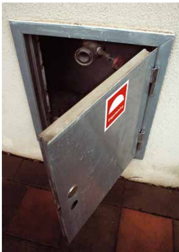
I stigarledningen i luckan på fasaden kan räddningstjänsten koppla in vatten. Inne i trapphuset finns sedan uttag där slangar kan anslutas.

I trapphus utgörs brandventilationen ibland av vanliga öppningsbara fönster. Det är viktigt att se till att lekande barn inte kan falla genom dessa. För att hindra olyckor kan exempelvis ett utvändigt galler användas.