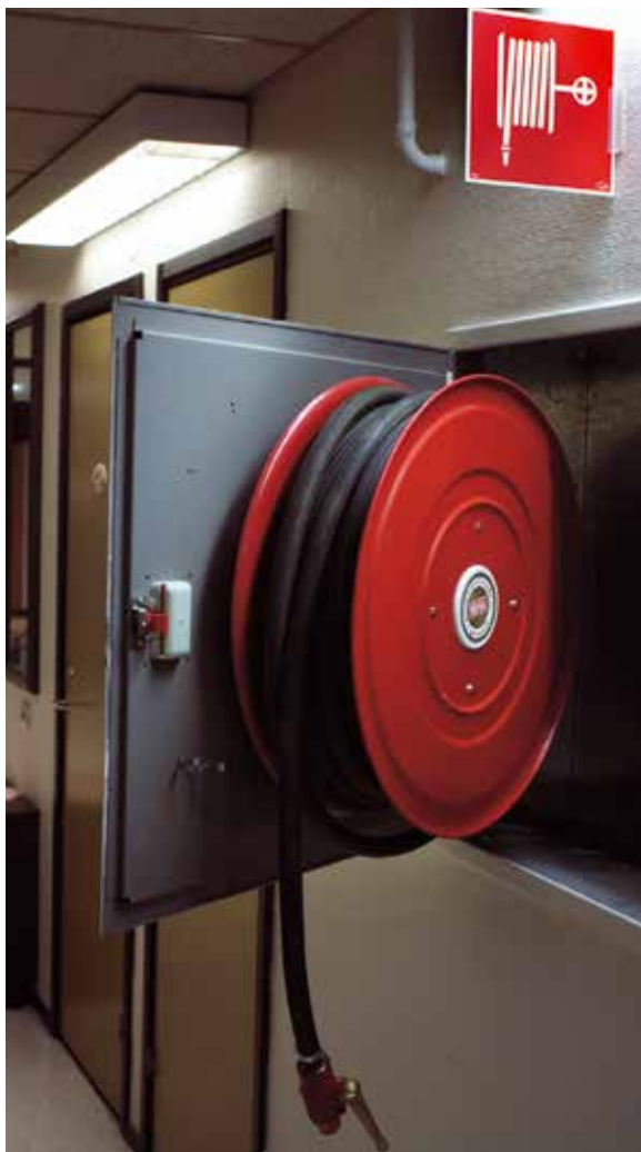
En vattenslang i styv plast är lätt att hantera och finns alltid på plats.