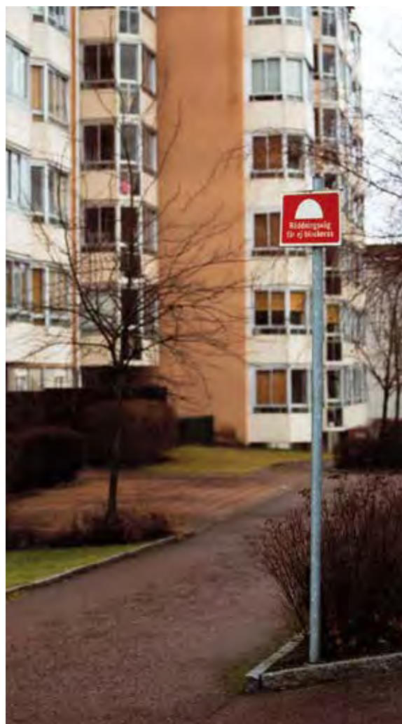
Räddningsvägar ska hållas snöröjda och fria från andra hinder.

Garage förses lämpligast med pulver-släckare eftersom pulver är effektivt mot motorbränder. En sådan fungerar på de flesta typer av bränder och kan användas även för övriga utrymmen. Handbrandsläckare riskerar att bli stulna. Vill man ha släckutrustning i allmänna utrymmen kan vattenslang på rulle i ett fast skåp vara ett bra alternativ.