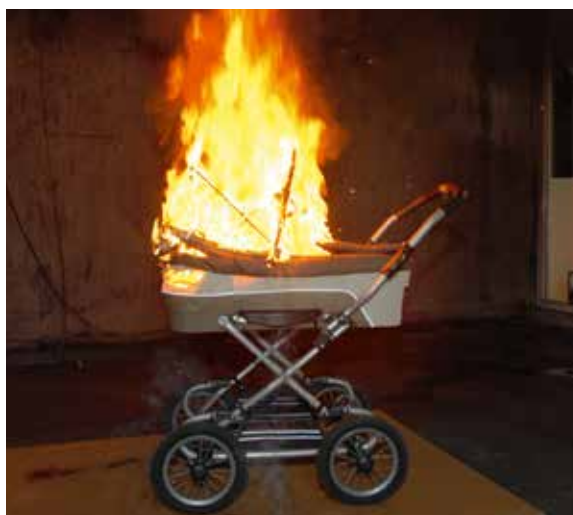
Håll trapphuset fritt från brännbart material och sådant som är i vägen vid en utrymning.

uthyrningen är det lämpligt att den som hyr ut lokalen för en dialog med hyresgästen om hur brandskyddet är tänkt att fungera när det gäller utrymningsvägar, tillåtet antal personer, eventuella larm med mera. I vissa fall kan det också vara lämpligt att tillsammans gå igenom lokalen/lokalerna innan de tas i bruk för arrangemanget. Det bör också finnas någon form av skriftlig brandskyddsinformation och checklista till hyresgästen. Sådana bör också vara uppsatta i lokalen.